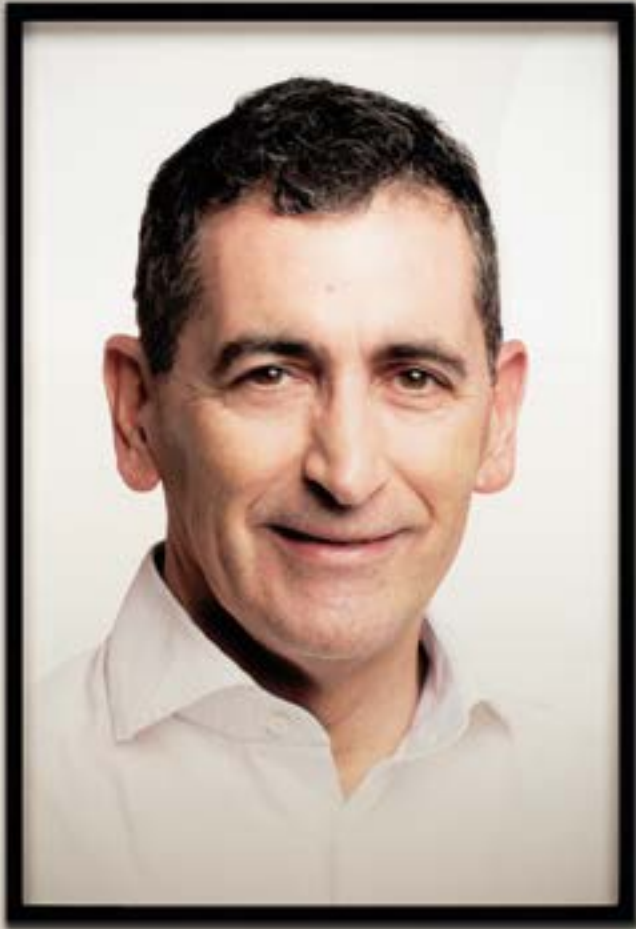
JUAN MAYORGA AUTOR I DIRECTOR